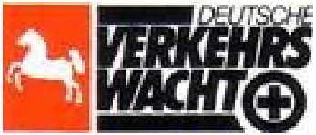
Verkehrswacht Harz-Braunlage und Umgebung e.V.