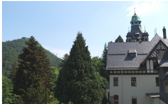
Niedersächsisches Internats- gymnasium Bad Harzburg