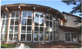
Stadt- und Schulbücherei Braunlage