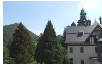
Niedersächsisches Internats- gymnasium Bad Harzburg